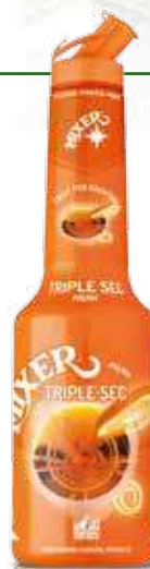
Triple Sec Mix