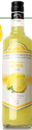
Succo di Limone