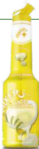
Sweet & Sour Mix