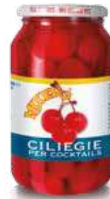
Ciliegie rosse con gambo 800 g