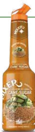
Zucchero di canna Cane Sugar