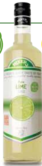
Succo di Lime

NO ADDED SUGAR NO ARTIFICIAL COLORS OR FLAVORS