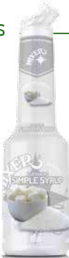
Zucchero bianco Simple Syrup