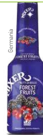
Frutti di bosco Forest Fruits