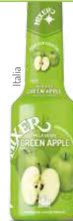
Mela verde Green apple