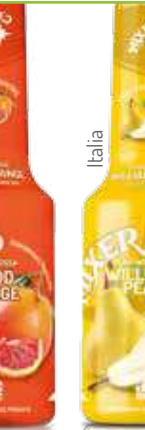
Pera Williams Williams Pear