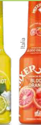
Arancia Rossa Blood Orange