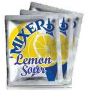
Lemon Sour Dry 70 g dose X 2 L